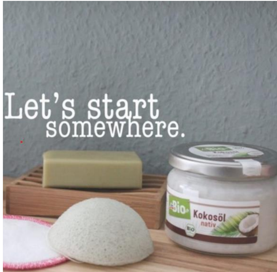
Buch „Selber machen Haut und Haar“